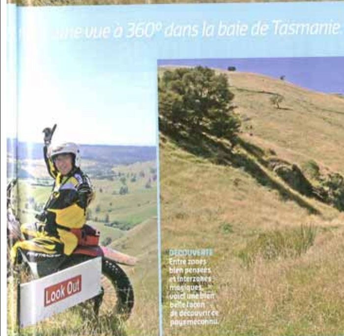
DECOUVERTE Entre zones bien pensées et interzones magiques, voici une bien belle façon de découvrir ce pays méconnu.

La seconde boucle est la plus longue dans