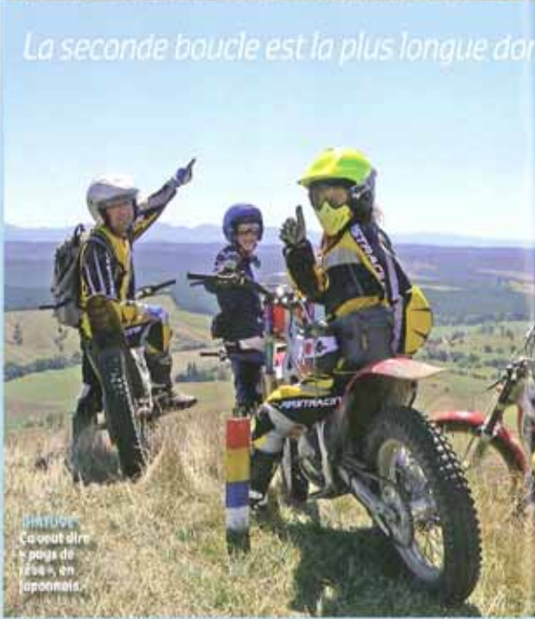
Ihatove C'est un air de pays de "rêve", en japonais.